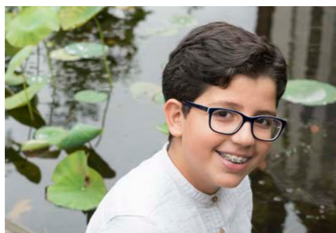
Selma klas 1a

'Ik heb vorig jaar met mijn moeder op 12 scholen gekeken. Op mijn voorkeurslijst stond het Comenius Lyceum op nummer 1 , trouwens ook op de lijst van mijn moeder. Ik vind de sfeer hier heel leuk.'